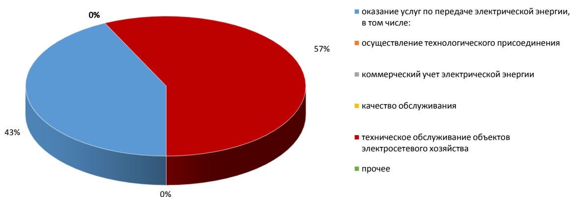
Категория обращений, в которой зарегистрировано наибольшее число обращений, содержащих заявку на оказание услуг